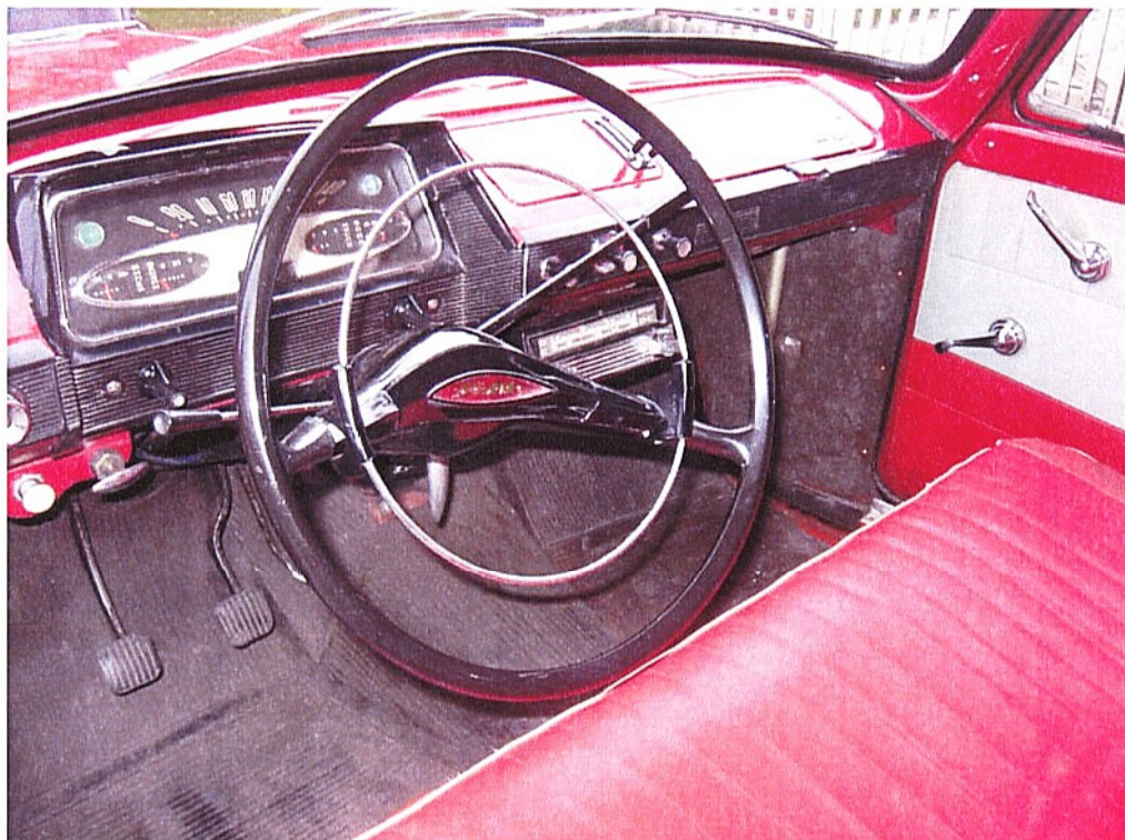
Vaade sõiduki armatuurlaualle ja juhtimisseadmetele