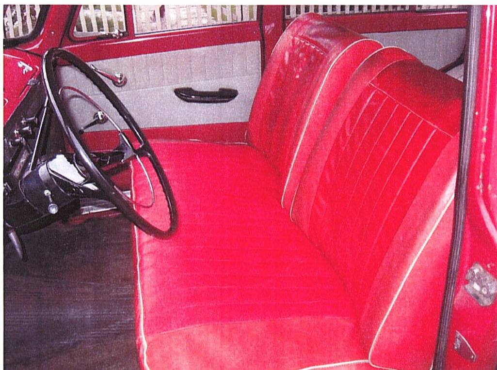
Vaade sõiduki istmetele (polsterdusele)